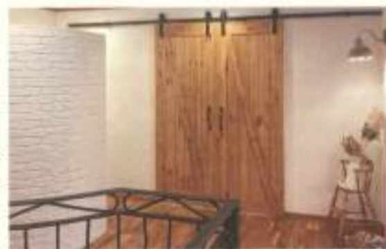
ハウディー株式会社