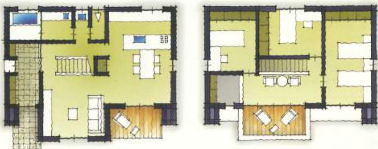
1F 17.0坪 2F 14.0坪 TOTAL 31.0坪