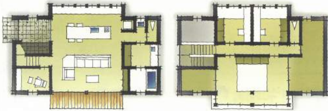
1F 19.5坪 2F 18.0坪 TOTAL 37.5坪